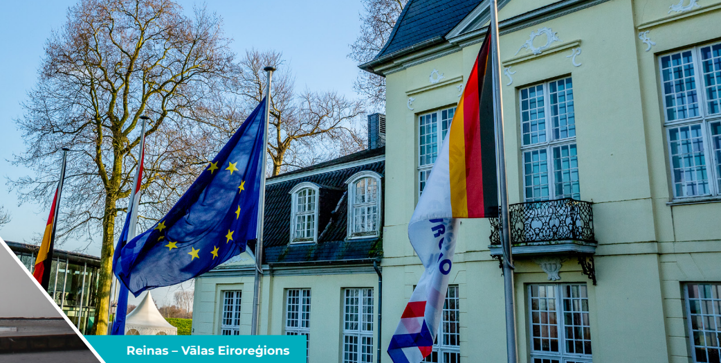
Reinas – Vālas Eioreģions