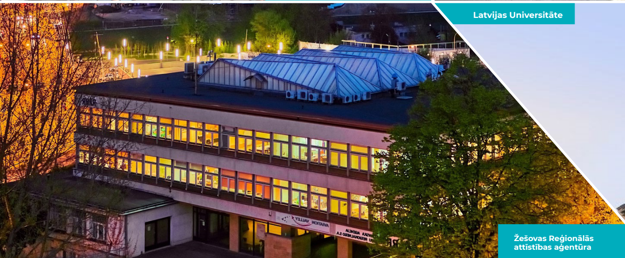
Žešovas Reģionālās attīstības aģentūra