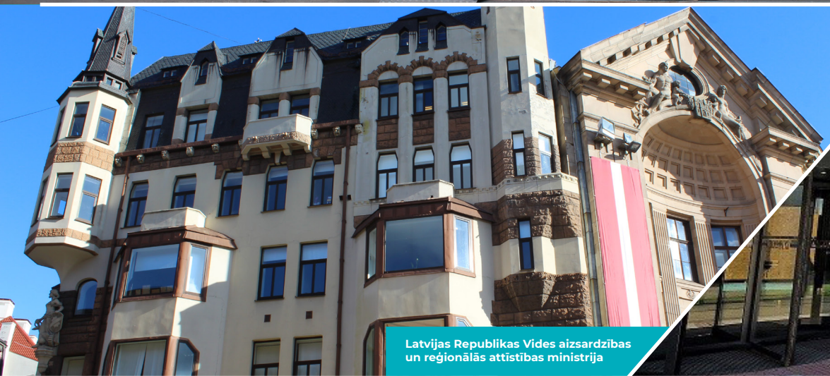
Latvijas Republikas Vides aizsardzības un reģionālās attīstības ministrija