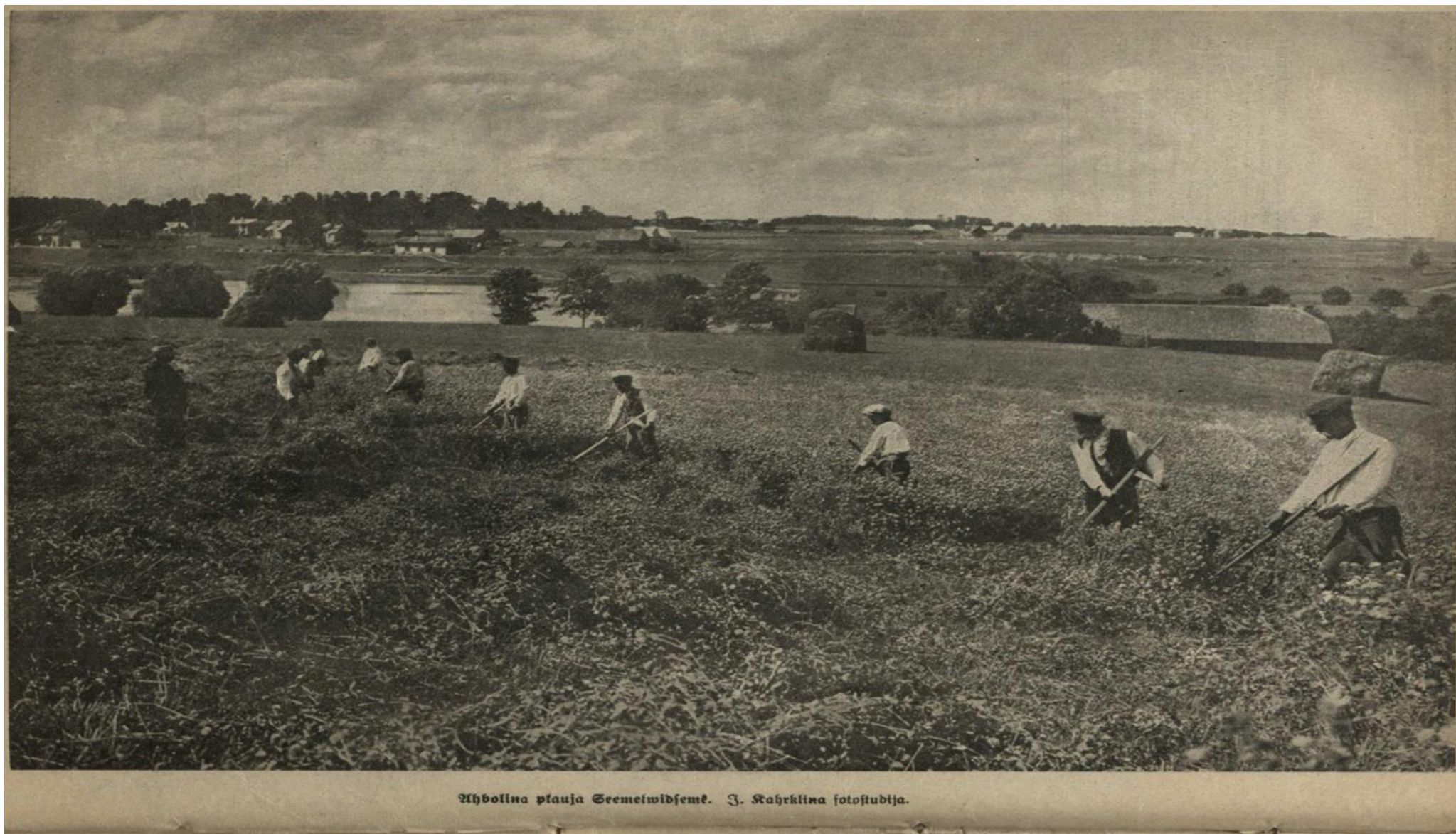
Āboliņa pļauja Semeļvidzemē.