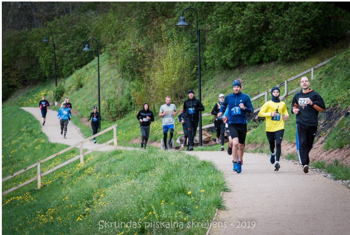
Škrundas pilskalņa skrējieni - 2019

Taka tiek izmantota pastaigām, aktīvai atpūtai un sportam.