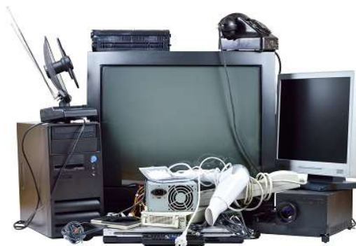
NOLIETOTO ELEKTROPREČU APSAIMNIEKOŠANU