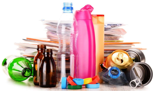
IZLIETOTĀ IPAKOJUMA APSAIMNIEKOŠANU