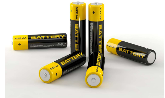
VIDEI KAITĪGO PREČU APSAIMNIEKOŠANU

100% ATBRĪVOJUMS NO DABAS RESURSU NODOKĻA SAMAKSAS*.