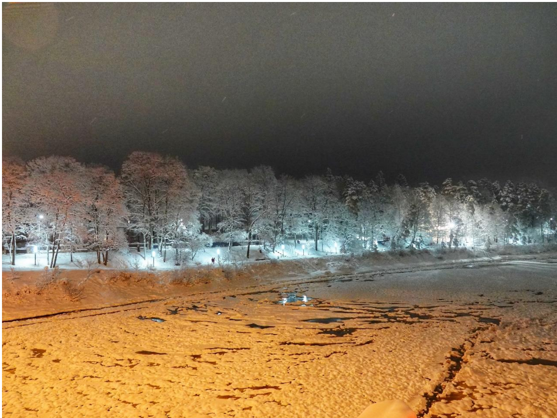
Attēla avots: Krasta promenāde Foto-A.Kursišs