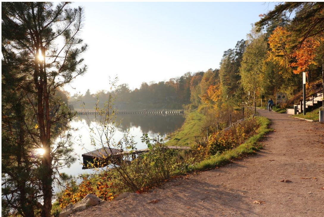
Attēla avots: Ogres novada pašvaldība