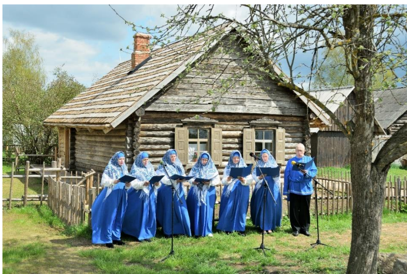
Lauku sēta Slutišķi 2 pēc pārbūves. Ekspozīcijas atklāšana.