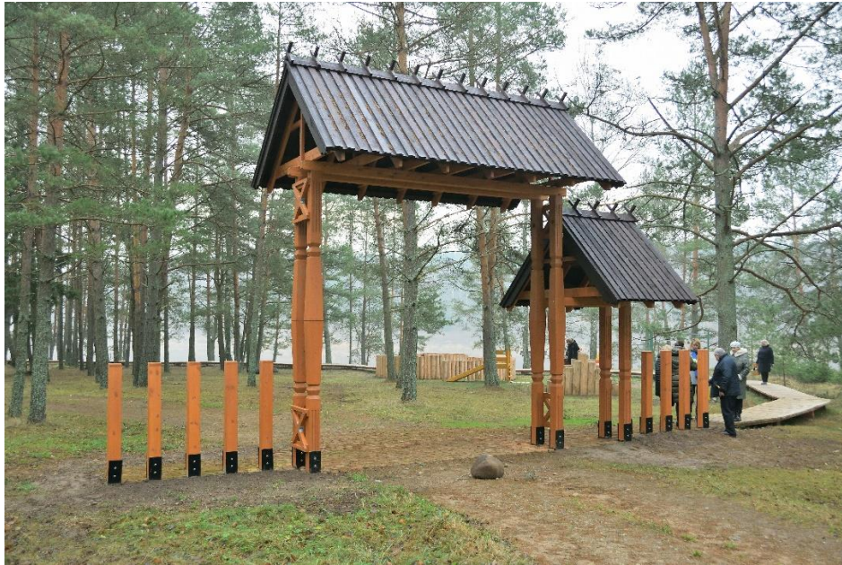
Atpūtas vietas "Latgales sēta" ieejas vārti. Autors Augšdaugavas novada pašvaldības Sabiedrisko attiecību nodaļa