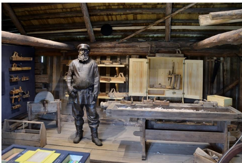
Lauku sēta "Slutišķi 2" (Upāni). Ekspozīcija.