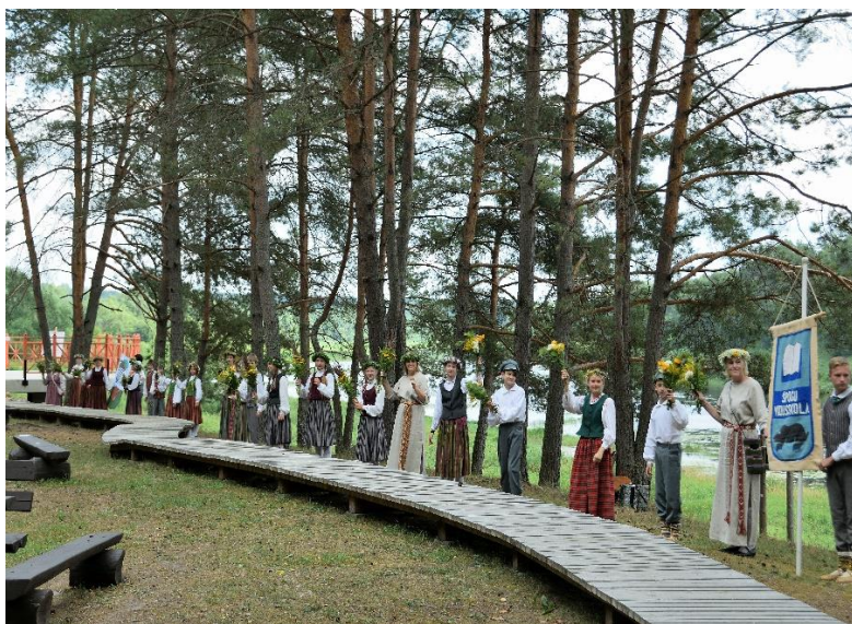
Atpūtas vietas “Latgales sēta” pastaigu taka. Dziesmu un deju svētki.