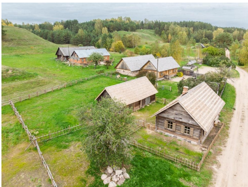
Slutišķu sādžas ainavas telpa. Tālskatā Markovas pilskalns.