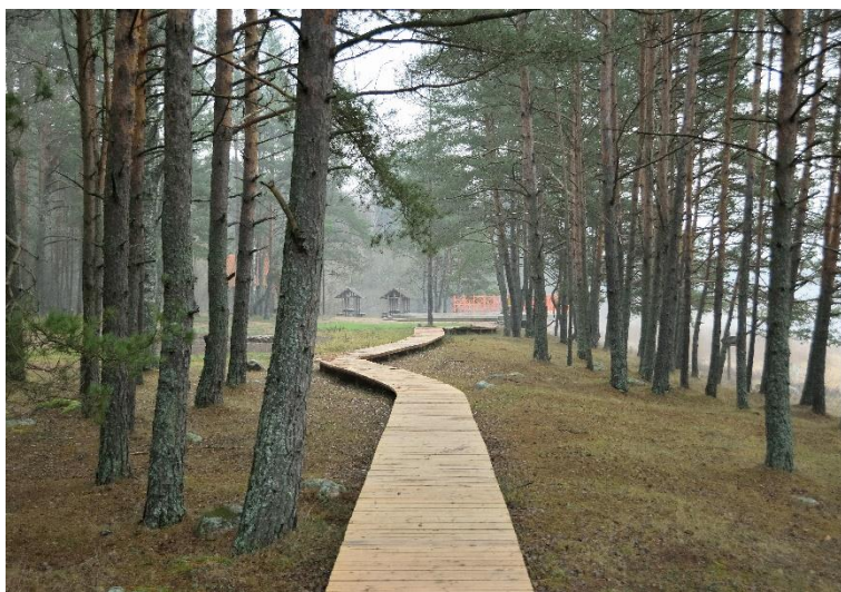
Atpūtas vietas "Latgales sēta" pastaigu taka.