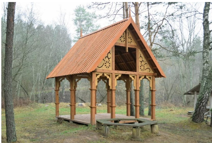
Atpūtas vietas "Latgales sēta" lapene.