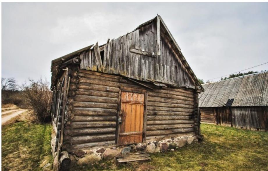
"Lauku sēta" Slutišķi 2 (Upāni) pirms pārbūves. Autors Augšdaugavas novada pašvaldības Sabiedrisko attiecību nodaļa.