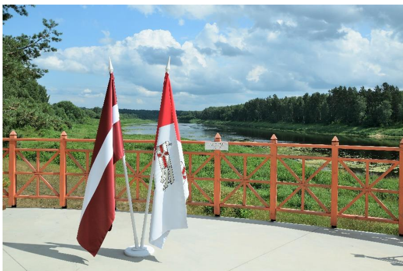
Atpūtas vietas “Latgales sēta” skatuve. Autors Augšdaugavas novada pašvaldības Sabiedrisko attiecību nodaļa

Daugavas loki/Slutišķu sādža: Vecticībnieku kultūras mantojuma centra izveide, radošās darbnīcas, piekļuves uzlabošana un Daugavas augšteces ainavas izcelšana