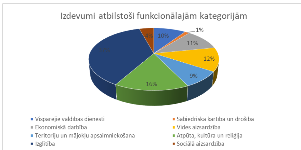
4.attēls. Dundagas novada pašvaldības pamatbudžeta izdevumi (%) 2020.gadā.