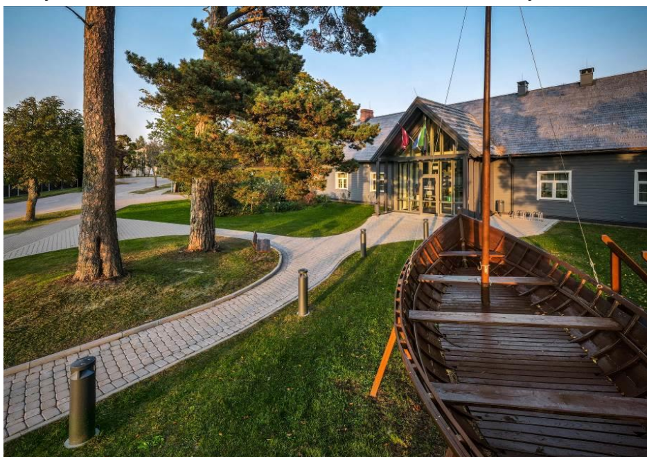
5.attēls. Lībiešu saieta nams.

Covid 19 vīrusa epidēmijas ierobežošanas nosacījumu dēļ Lībiešu saieta namā 2020. gadā ir notikuši mazāks skaits kultūras un izklaides pasākumu, nekā iepriekšējos gados. Notikuši 28 pasākumi un bijušas 6 mainīgās izstādes. 22,5% no Lībiešu saieta nama apmeklētājiem ir bijuši Dundagas novada iedzīvotāji, kas pārsvarā apmeklējuši Lauku labumu tirdziņus vai apskatījuši kādu konkrētu izstādi. Ņemot vērā situāciju pasaulē un ceļošanas ierobežojumus, tikai 21% no Lībiešu saieta nama apmeklētājiem ir bijuši ārzemnieki (atšķirībā no 2019. gada, kad ārzemju viesi bija 29% no visiem apmeklētājiem). Lielai daļai apmeklētāju nav noskaidrota valsts piederība, taču no zināmajiem visvairāk pārstāvētās valstis tradicionāli ir Lietuva, Igaunija un Vācija, kam apmeklētāju skaita ziņā seko Itālija, Polija, Somija, Šveice, Francija, Krievija, Dānija, Beļģija, Čehija, Austrija, Ungārija, Kanāda, Slovākija, Spānija, Lielbritānija, Nīderlande, Gruzija, Ukraina, Zviedrija. Tūrisma sezonas laikā ir novadītas 29 ekskursijas un nodarbības dažādu vecuma grupu apmeklētājiem gan latviešu, gan angļu valodā (atšķirībā no 2019. gada, kad notika 50 ekskursijas/nodarbības). Kolkas Lībiešu saieta nama piedāvājums skolām ir atrodams vietnē www.skolenukursijas.lv .