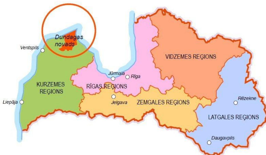
1.attēls. Dundagas novada novietojums Latvijā.

Dundagas novadu veido Dundagas un Kolkas pagasti, novads atrodas Kurzemes ziemeļu daļā. Novada platība ir 676,06 km 2 , ietilpst Kurzemes plānošanas reģionā.