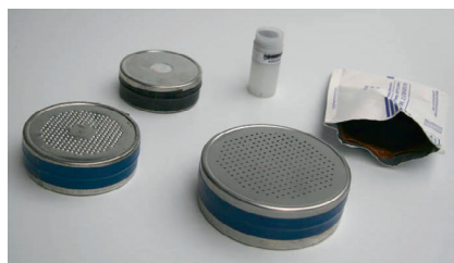
Radona ogle detektors 10

Ievērojot, ka radona līmenis mainās laikā un arī ir atkarīgs no sezonas, tad labākais risinājums ir izvietot detektorus mērīšanai ilgāku periodu (vismaz 6 mēneši), kas raksturo vidējo gada vērtību.